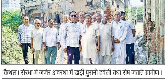
कैथल। सेरधा में जर्जर अवस्था में खड़ी पुरानी हवेली तथा रोष जताते ग्रामीण।