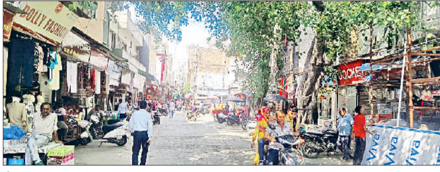
जीद। श्राद्ध पक्ष के चलते सुनसान नजर आ रहा बाजार।

पितृ पक्ष (श्राद्ध) शुरू हो चुके हैं और बाजार से ग्राहकों की रौनक पूरी तरह से गायब हो चुकी है। ग्राहकों से खचाखच रहने वाला जीद के बाजार में दुकानदार ग्राहकों की बाट जोहते नजर आ रहे हैं। दिन होते-होते बाजार में सन्नाट छा जाता है। जिन दुकानदारों को दोपहर के समय सांस लेने तक की फुर्सत नहीं होती थी वो दुकानदार अब ग्राहकों का इंतजार करते हुए नजर आते हैं। दुकान पर ग्राहक नजर नहीं आ रहे हैं। धंधा इस कदर मंदा हो गया है, जिसे सोच कर दुकान मालिक सिहर रहे हैं। सबसे ज्यादा परेशानी उन दुकानदारों की बढ़ गई है जिन्होंने महंगे किरायों पर दुकानें लीं हैं। हालात यह हैं कि दुकान का किराया निकलने की भी उम्मीद नहीं दिख रही है। किसी-किसी दिन तो बोहनी तक नहीं होती है। अब