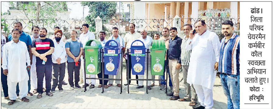
स्वच्छ भारत मिशन को जन-जन तक पहुंचाने के लिए जिला परिषद व ग्राम पंचायत मिलकर गांव को स्वच्छ बनाने का कार्य कर रहे हैं।