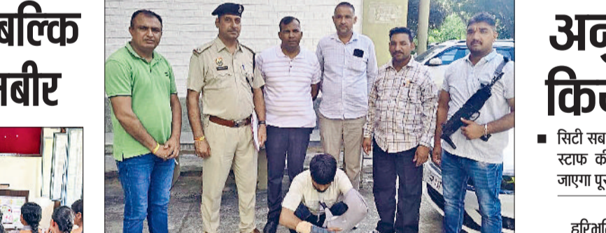
कैथल। अवैध असला रखने का आरोपी सीआईए-1 पुलिस गिरफ्त में।