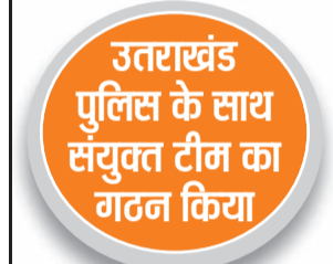
उतराखंड पुलिस के साथ संयुक्त टीम का गठन किया