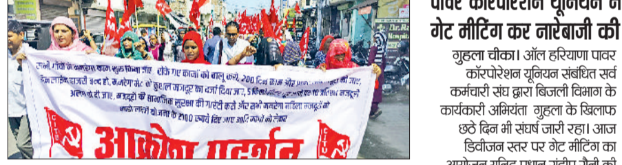
जींद। प्रदर्शन में शामिल मनरेगा मेट और मजदूर।

जिला नगर योजनाकार द्वारा आम लोगों से अपील की है कि वे किसी कालोनी में प्लाट लेने से पहले उसकी वैधता जरूर चेक कर लें। उन्होंने बताया कि शहर में अवैध निर्माणों व अवैध कालोनियों को किसी भी सूत्र में पनपने नहीं दिया जाएगा। अवैध निर्माण करने वालों पर कार्रवाई अमल में लाई जाएगी।