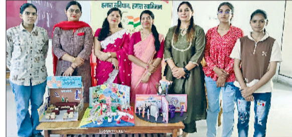
जीट। प्रतियोगिता की विजेता छात्राएं स्टाफ सदस्यों के साथ।