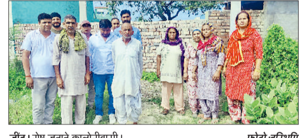
जींद। रोष जताते कालोनीवासी।

काटा था। उसने पुलिस कर्मचारियों के सामने ही सफाई कर्मचारी को बुलाकर गेट खुलवाया। बैंक के अंदर जाकर देखा तो सारा सामान सुरक्षित पाया गया। शिकायतकर्ता ने अंदेशा जताया कि अज्ञात ने बैंक में चोरी का प्रयास किया है।