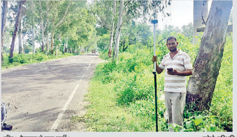
जींद। पैमाइश में लगा कर्मी।

कंपनी के कर्मचारियों ने मंगलवार को जींद तक इसका लेवल किया। लेवल का काम पूरा होने के बाद सड़क के लिए टेडर अलॉट होगा। इसके लिए पंचायती विभाग को वन विभाग के नाम जमीन करवाने करवानी है। यह प्रक्रिया भी चली हुई है। जमीन वन विभाग के नाम करवाने के लिए पंचायती विभाग काम कर रहा है। इसके लिए फाइल मुख्यालय गई हुई है। वर्ष 2020 में इस सड़क के निर्माण को लेकर घोषणा हुई थी। उसके बाद यह निर्माण कार्य दस्तावेजों में उलझ गया। सड़क बनाने से पहले इसके दोनों तरफ लगे पेड़ों की कटाई होनी है। यह पेड़ उस समय तक नहीं कट सकते जब तक वन विभाग इसकी मंजूरी नहीं देता। इसके लिए लगभग 42 एकड़ जमीन पंचायती विभाग को वन विभाग के नाम करवानी है ताकि जितने पेड़ काटे जाएंगे। उतने पेड़ वह लगा सके। जमीन की तलाश करने में ही दो से तीन वर्ष का समय लग गया। अब लगभग छह माह पहले जमीन भी मिल गई थी लेकिन अब तक यह वन विभाग के नाम नहीं हो सकी। इसके अतिरिक्त सड़क निर्माण को लेकर सभी कार्यों की तैयारी पूरी की जा चुकी है। अब जमीन ट्रांसफर होने का ही इंतजार बना है।