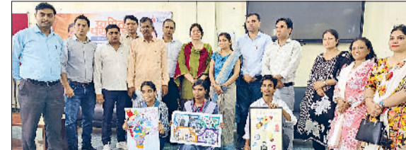
जीद। प्रतियोगिता के विजेता विद्यार्थी स्टाफ के साथ।

राजकीय औद्योगिक प्रशिक्षण संस्थान (आईटीआई) में मंगलवार को उद्यमिता पखवाड़ा के तहत जिला स्तरीय प्रतियोगिता का आयोजन उत्साह और ऊर्जा से भरे वातावरण में किया गया। कार्यक्रम में जिलेभर के विभिन्न शैक्षणिक संस्थानों से बड़ी संख्या में छात्र व छात्राओं ने भाग लेकर अपनी प्रतिभा और रचनात्मकता का प्रदर्शन किया। पखवाड़ा कार्यक्रम के अंतर्गत बिजनेस आइडिया प्रतियोगिता, स्लोगन लेखन प्रतियोगिता और पोस्टर मेकिंग