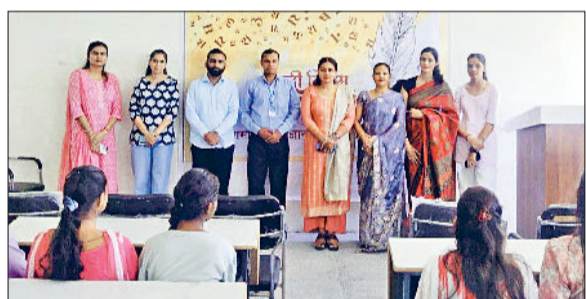
कैथल। एनआइआइएलएम विश्वविद्यालय में हिन्दी दिवस मनाते पदाधिकारी।

कैथल। सांसद खेल महोत्सव के सफल आयोजन को लेकर जिन्दल हाउस कैथल में एक बैठक हुई। जिसका उद्देश्य जिला कैथल के सभी स्टेडियम, खेल नर्सरी, खेल प्रशिक्षण संस्थान, स्कूल, कॉलेज और शिक्षण संस्थानों के विद्यार्थियों और युवाओं को सांसद खेल महोत्सव के लिए प्रेरित करना और इसमें उनकी अधिक से अधिक भागीदारी सुनिश्चित करना रहा। कुरुक्षेत्र संसदीय क्षेत्र में अधिक से अधिक युवा भाग ले सकें।