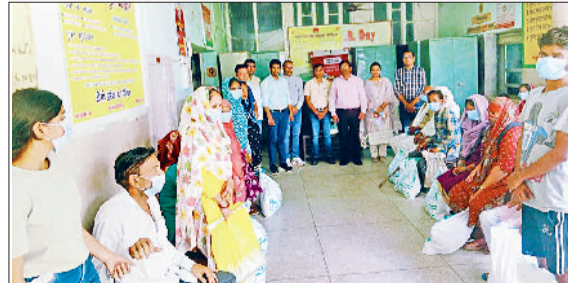
जीट। मरीजों को आहार कित देने के मौके पर मौजूद स्टाफ सदस्य।